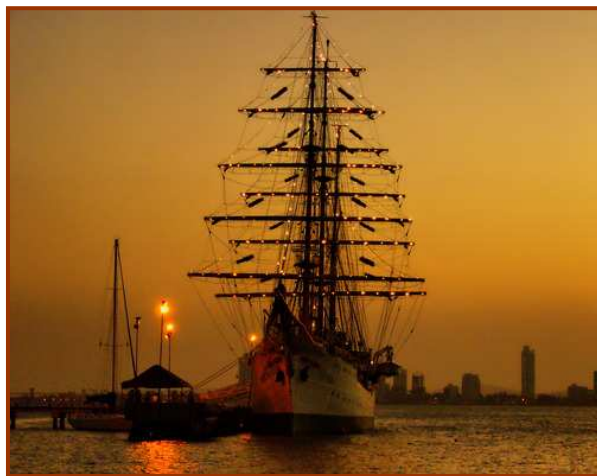
Buque Insignia Gloria, Armada Nacional de Colombia.